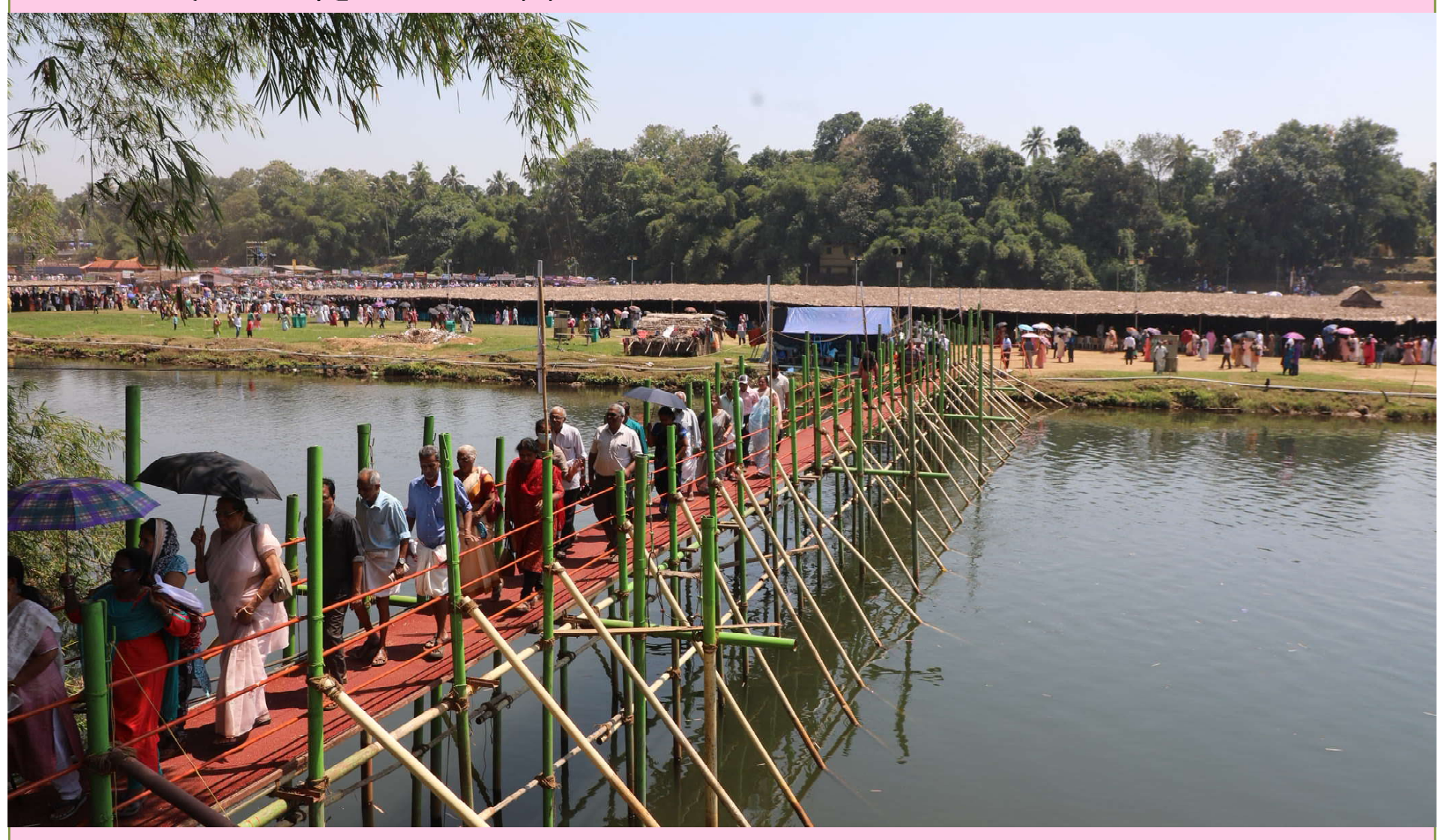
പൊതുയോഗത്തിന് ശേഷം മടങ്ങുന്ന വിശ്വാസികൾ